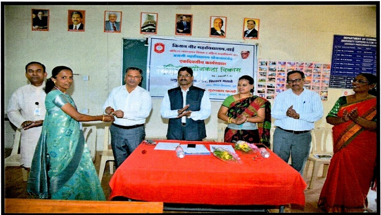
Welcoming of All Honourable Guests